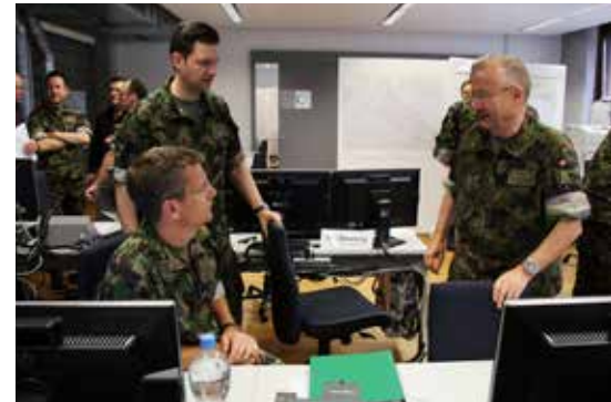
4 Verteidigungsoperation NEPTUN