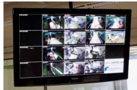
5 ELTAM Übungsanlage auf Weltklasseniveau